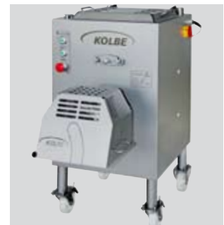
Auslaufschutzhaube Outlet protection