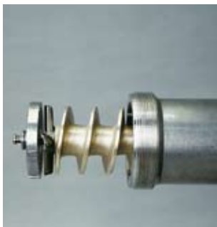
Schneidsystem Enterprise Cutting system Enterprise