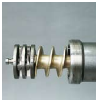
Schneidsystem Unger Cutting system Unger