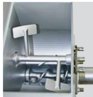
Mischtrichter mit Autoreversefunktion Mixing unit with autoreverse function